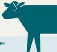
Varme og fugtigheds index for kvæg (THI)